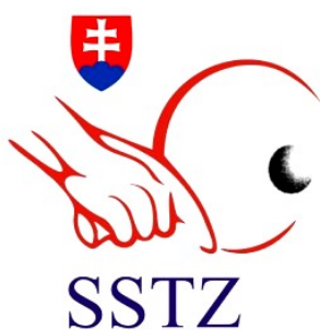
TABLE TENNIS FOR EVERYONE, EVERYWHERE